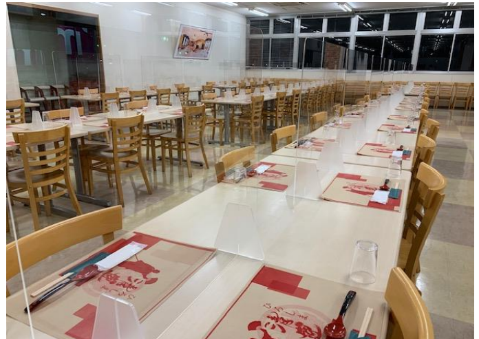
【改善後】アクリル板で仕切り4名配席